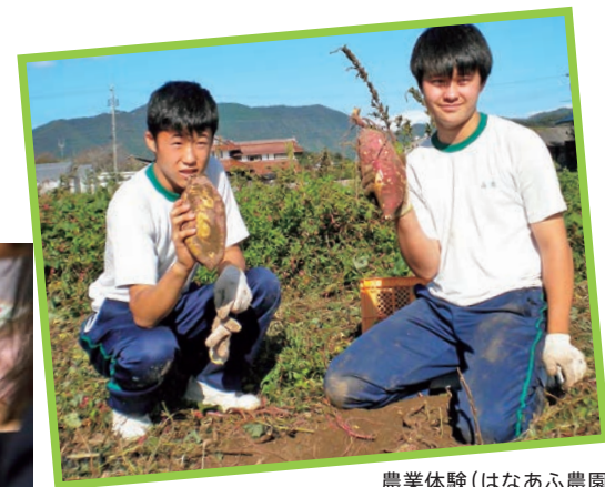
農業体験 (はなあふ農園)