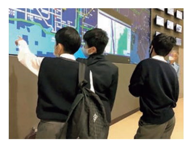
社会見学 (広島県警察本部)