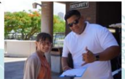
現地の人にインタビューしたり、 核廃絶の署名活動もしたり。