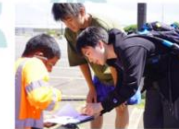
プレゼンの 準備で大学内 の人に英語で ドキドキの インタビュー!

2年生の夏には、約1ヶ月間のハワイ研修があります。学生数8000人以上の、ハワイのコミュニティーカレッジの中では2番目に大きな規模の大学で研修を行うプログラムです。ここで紹介しているのは、1期生(2018年度入学生)の様子です!