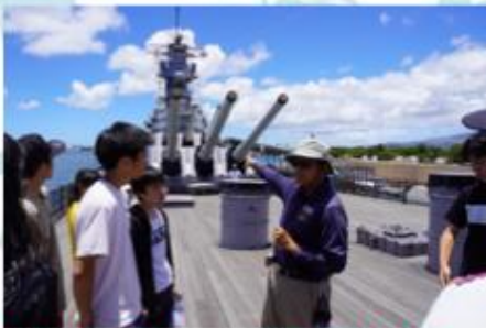
戦艦ミズーリはとても迫力がありました。 Karin