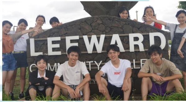
1か月間お世話になった、「リーワード」コミュニティーカレッジ